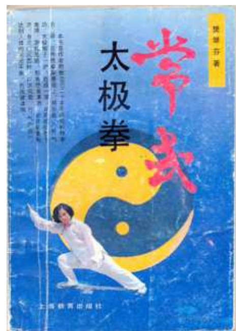
Les couvertures des livres du maître Wang Bo (Shanghai, 2001) et de Fan Jifen (Shanghai, 1991)