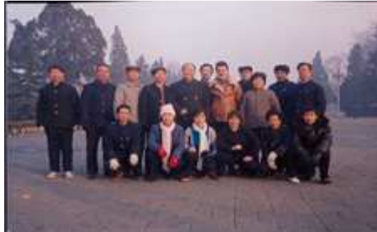
Avec le maître Yang Zhenduo et quelques-uns de ses élèves en 1989