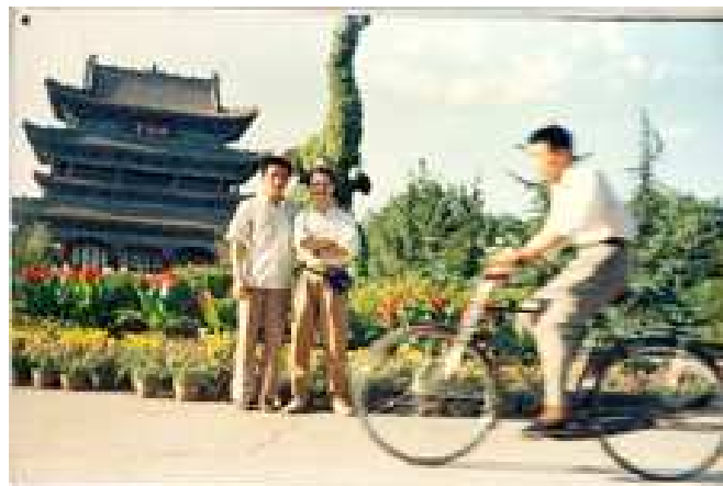
La photo du siècle avec Petit Yuan