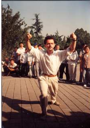
Une démo devant des élèves ébahis de maître Yang

musculaire notamment au niveau des jambes lors des transferts du poids du corps et une recherche de pesanteur dans les membres supérieurs, cette sensation du jing (force-énergie) qui, pour lui, était le grand secret du Taiji quan. Pas le qi (souffle) dont il ne parlait jamais et qu'il laissait aux adeptes du qigong , mais bien le jing sans lequel le pratiquant est « vide » ( kong ) et donne l'impression de flotter.