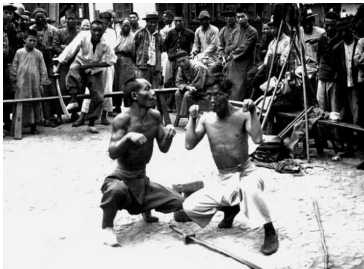
Adeptes chinois du kung-fu possédés par le dieu singe