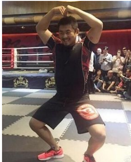
Xu Xiaodong juste après sa victoire contre le maître de taichi Wei Lei