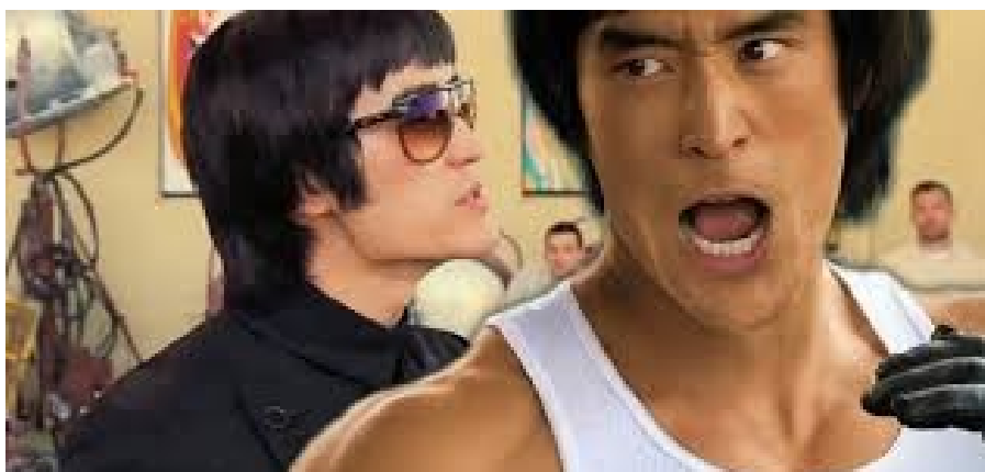
Bruce Lee vu par Tarantino dans Once Upon a Time in Hollywood

nécessités du moment _ en l'occurrence exploiter la mode déclenchée par le cinéma kung-fu et la fascination des Occidentaux _ qui peut rendre le maître asiatique si flexible voire tortueux. Ainsi, le tour de force d'un Bruce Lee n'aura pas été de prouver sa supériorité dans la lice, mais bien de s'être mythifié lui-même. Bien entendu, il est toujours possible que survienne un contradicteur comme le suggère Quentin Tarantino dans une scène fameuse de son Once Upon a Time in Hollywood . Quel sens cela a-t-il de faire un procès à un cinéaste qui donne sa propre interprétation d'un mythe cinématographique _ le Petit Dragon comme héros de toute une génération _ qu'une habile propagande vise à identifier à l'homme réel ? Bruce Lee marque bien le moment où tout s'est inversé. Alors que dans la réalité n'importe quel expert est susceptible d'être confronté à ses limites, le monde des images se nourrit d'illusions illimitées et le héros devient invincible. C'est le spectacle selon Guy Debord, autrement dit le faux comme vrai incontestable 12 .