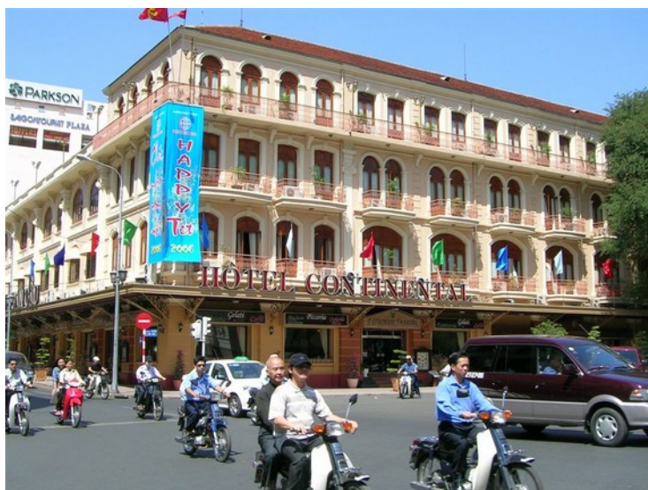
L'Hôtel Continental en 2006 (Wikipédia photo Terence)