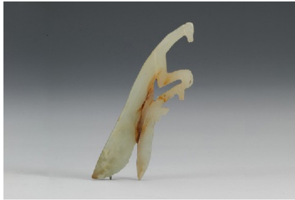
Mante religieuse en jade retrouvée dans une tombe de la dynastie Zhou de l'Ouest (1046 à 771 av. J.-C).