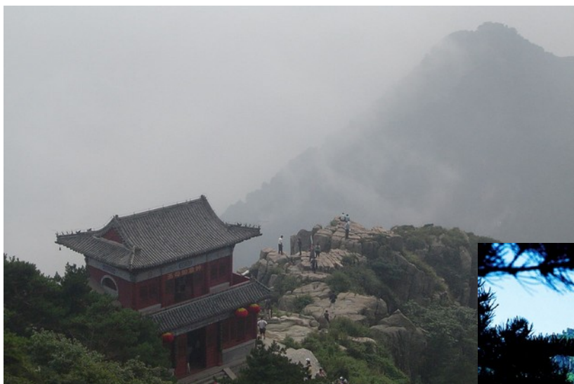
Une vue du mont Tai. Ci-contre, l'Escalier du Ciel.