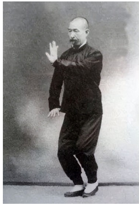
Bagua zhang (à gauche) et taiji quan de style Sun (à droite)