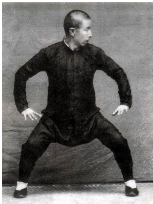
Un corps particulièrement mince mais recelant une puissance insoupçonnée (boxe xingyi )