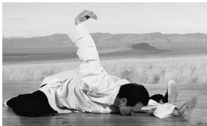
Posture de l'aspi... euh, du dragon qui entre dans la terre