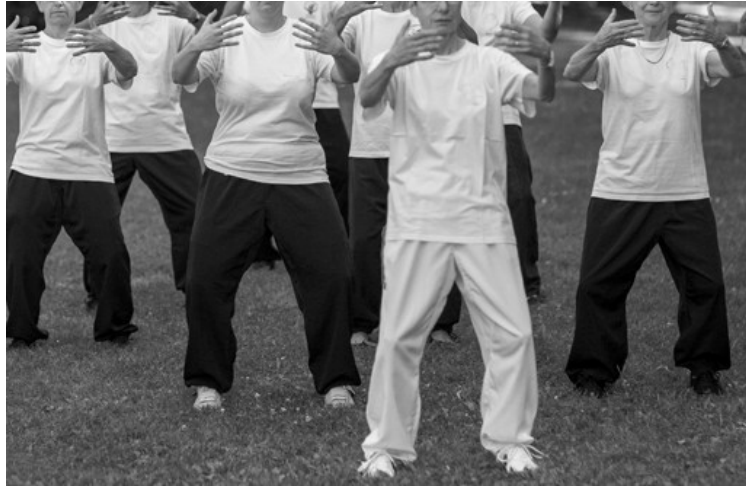
Posture de l'arbre