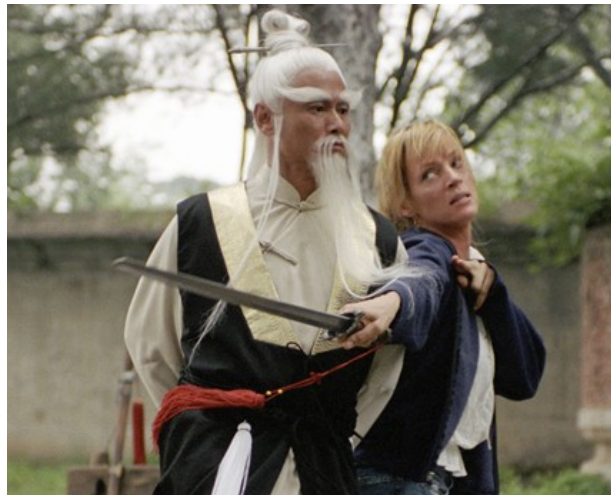
Uma Thurman essayant de se décoller d'un taoïste

Taoïsme : Courant de la pensée chinoise compatible avec l'écologisme, l'anarchisme et la consommation d'alcool (voir Li Bai et Zhuangzi). Dans certains lieux en Chine, un pseudo-taoïsme sert à attirer les touristes. Dans sa version Huang-Lao, c'est aussi un système cynique de gouvernement (voir Tête). Le taoïste peut être collant.