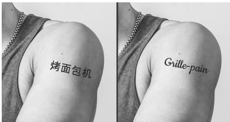
Exemple de tatouage crétin

Calligraphie : Art chinois de l'écriture. À ne pas confondre avec le dessin d'enfant ou le tatouage crétin.