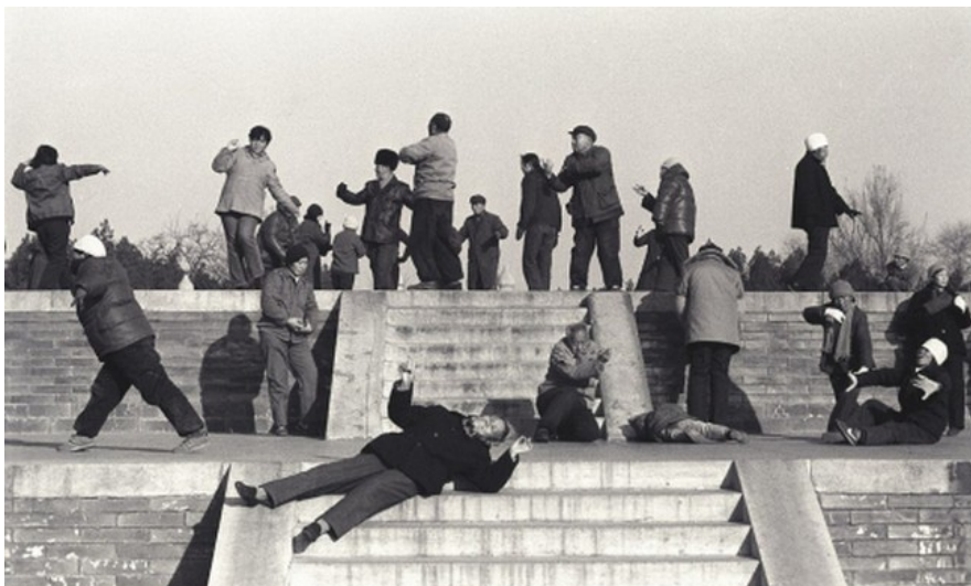
Pic de fièvre dans un parc pékinois (photo Huang Xiaobing, 1989)

Fièvre du Qigong (Chikung*) : La Chine a éradiqué cette étrange maladie sans pouvoir empêcher la contamination de visiteurs étrangers.