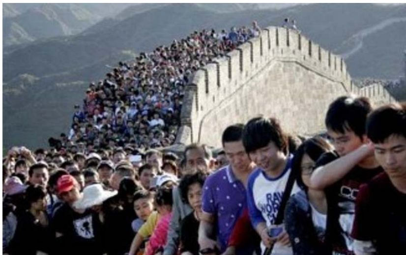
Finalement, nous n'avons rien raté