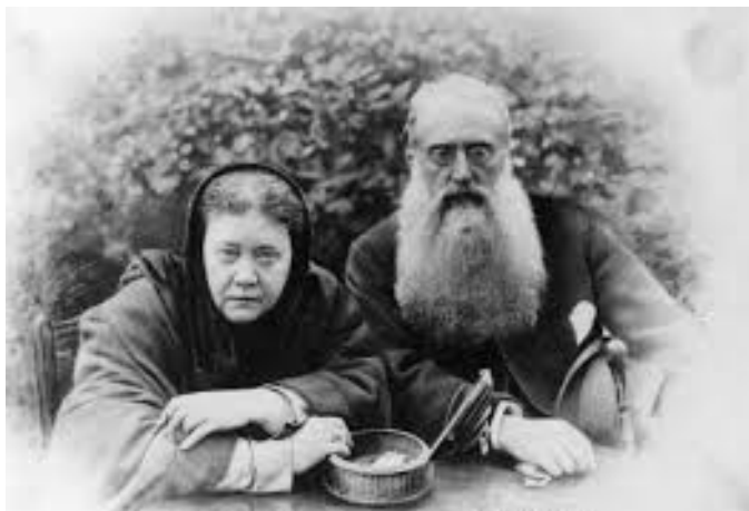
Blavatsky et Olcott