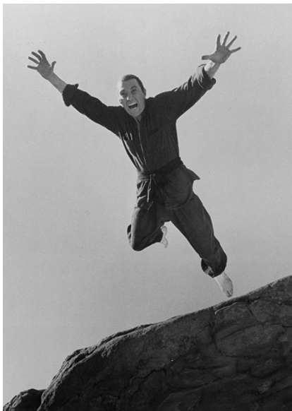
Kwai Chang Caine, bien décidé à en finir avec la pseudo-tradition

Ainsi, de la même façon que l'on se garde les bons petits plats pour la table familiale, il fut un temps pas si lointain où l'art martial made in Hong Kong était encore réservé à la diaspora, aux arrières salles donc. L'époque en question se situe au milieu des années 1970, en ces âges farouches où quelques pitres singeaient sans vergogne les exploits du moine Shaolin Kwai Chang Caine. Aujourd'hui, on pourrait s'étonner de continuer à voir s'agiter certains de ces olibrius qui auraient dû disparaître depuis longtemps, ensevelis sous des montagnes de quolibets. Pensez donc ! Ceux-là ont même gagné leurs titres de maître à l'ancienneté ! En toute logique d'ailleurs, puisque c'était le prix à payer pour que le public ne s'aperçoive pas que cette histoire avait commencé dans le registre de la foutaise.