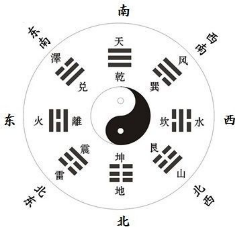
Le symbole du Taiji entouré des Huit trigrammes disposés selon les huit directions de l'espace

Voyons à présent ce qu'il en est pour la pratique du Taiji quan.