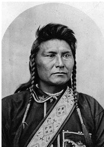
Un samouraï d'Amérique : Hin-mah-too-yah-lat-kekht (Chef Joseph, 1840-1904)

L'exposition Samouraï, 1000 ans d'histoire du Japon qui se tint du 28 juin au 11 novembre 2014 dans le Château des ducs de Bretagne à Nantes présentait au public 450 objets dont une impressionnante collection de casques ( kabuto ) et de mentonnières ( mempo ) 1 . La visite se clôturait sur un rappel de l'influence de l'image du samouraï sur la culture contemporaine. On passait ainsi des indéniables beautés des périodes Muromachi ou Edo à la laideur des créatures de la S.F. nippone pour finalement se retrouver devant l'affiche du film Le Dernier samouraï (Edward Zwick, 2003) et l'armure en plastique de Dark Vador. En résumé, un millénaire d'histoire qui s'achevait avec Hollywood, sa bouffonesque Guerre des Etoiles et Tom Cruise dans la peau d'un héros improbable fort affairé à sauver à lui tout seul l'esprit du Japon traditionnel...