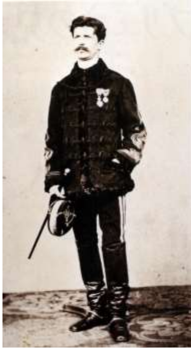
Jules Brunet, le « vrai » samouraï